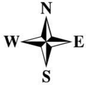
СХЕМА ГРАДОСТРОИТЕЛЬНОГО ЗОНИРОВАНИЯ ТЕРРИТОРИИ